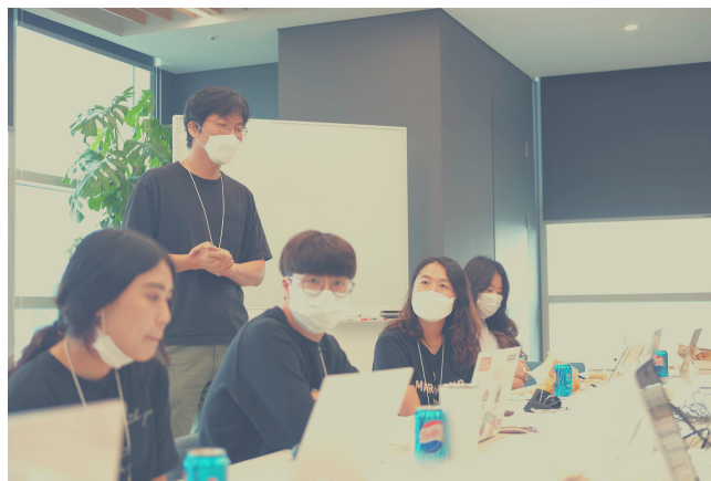
2020 노을 일잘러 아카데미

노을은 창업 초기부터 모든 구성원의 자기 계발을 위한 외부 교육이나 세미나를 인당 교육비에 구애받지 않고 적극적으로 지원해왔습니다. 이에 더해, 2020년부터는 구성원의 니즈를 보다 구체적으로 파악하여 적절한 교육 프로그램을 보다 적극적으로 개발, 제공해나가고 있습니다. 대표적으로, 2020년 8월부터 약 2개월간 노을 일잘러아카데미 프로그램 을 개발하여 운영했습니다. 신입 구성원과 주니어 구성원 위주로 참여하여 문서 작성, 소통, 협업, 기획, 비즈니스 매너 등 업무의 기본기를 다지고 직접 스스로 프로젝트를 기획하고 완성하는 과정을 진행했습니다.