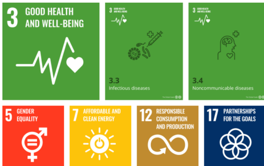
노엘이 관심을 두고 있는 SDGs

노엘의 비즈니스는 유엔 지속가능발전목표의 세 번째 목표인 건강하고 질 좋은 삶(Good Health and Well-being)의 달성에 직간접적으로 기여합니다. 회사의 비즈니스 전략과 소셜임팩트 전략 구체화 시 먼저 UN SDGs를 연계하며 발전시켜나가고 있습니다.